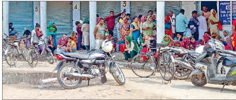
नारनौल। राशन डिपो पर खड़े लोग।

कार्डों की सूची को अंतिम रूप दिया जा चुका है। इस प्रकार जून एवं जुलाई माह में कुल 14 हजार राशन कार्ड काटे गए हैं, जिन्हें अब सस्ता राशन नहीं मिलेगा।