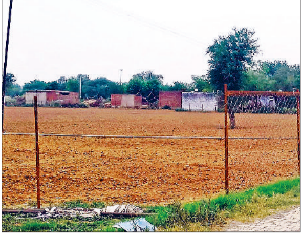
मंडी अटेली। गांव में स्टेडियम के लिए खेत में की गई तारबाड़।

अटेली और बेगपुर के ग्रामीणों में पिछले दो सप्ताह से चल रहा विवाद बढ़ता जा रहा है। बेगपुर के लोगों द्वारा इसको लेकर चार दिन पूर्व एसपी से मुलाकात की थी। अटेली के लोगों का कहना है कि इस जमीन पर लगे खेल स्टेडियम के बोर्ड को ठाकुर जी महाराज मंदिर ट्रस्ट के लोगों ने हटा दिया। गांव बेगपुर में ठाकुर जी महाराज का मंदिर बना हुआ है। ग्रामीण व मंदिर कमेटी के अनुसार इस मंदिर की सात एकड़ जमीन अटेली गांव में भी पड़ती है। इस जमीन पर अटेली की पंचायत द्वारा स्टेडियम बनाया जा रहा है। इसको लेकर गत दिनों बेगपुर गांव के लोगों व ठाकुर मंदिर कमेटी के लोगों ने एसपी व डीसी से भी मुलाकात की थी। वहीं अब ठाकुरजी मंदिर के जमीन में खेलों को बढ़ावा देने के लिए ग्राम पंचायत अटेली द्वारा गांव में बनाए गए खेल स्टेडियम के संकेतक बोर्ड को तोड़ने पर अटेली ग्राम पंचायत व ग्रामीणों में आक्रोश बढ़ गया है।