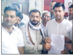
महेन्द्रगढ़। जिला अध्यक्ष को ज्ञान सौंपते हुए।