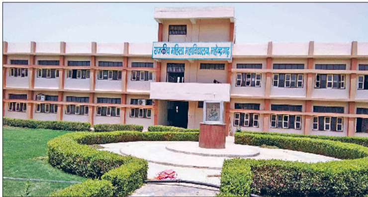
महेंद्रगढ़। राजकीय महिला महाविद्यालय।

बता दें कि गत माह उच्चतर शिक्षा विभाग की ओर से स्नातक कोर्स के दाखिले का शेड्यूल जारी किया गया था। विभाग की ओर से कॉलेजों 14 से 17 मई तक पोर्टल पर डाटा अपलोड करने का समय दिया गया था। वहीं विद्यार्थियों को नौ जून तक ऑनलाइन आवेदन करने का समय दिया गया था, लेकिन कॉलेज में करीब 50 प्रतिशत सीट खाली रह गई थी। ऐसे विभाग की ओर से एक सप्ताह के लिए अंतिम तिथि को बढ़ा दिया गया था। विभाग की ओर से जारी शेड्यूल के अनुसार 17 जून की रात 12 बजे तक अपने आवेदन में सुधार कर सकेंगे। आवेदन प्रक्रिया समाप्त होने के बाद अभी भी कॉलेजों में 30 प्रतिशत सीटें खाली रह गई है। 26 जून को पहली मेरिट लिस्ट जारी होगी। मेरिट लिस्ट में शामिल विद्यार्थी 30 जून तक फीस भर कॉलेज में दाखिला ले सकेंगे।